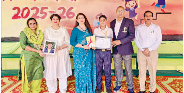
खरखौदा। विद्यार्थी को पुरस्कृत करते हुए प्रताप स्कूल प्रबंधन।