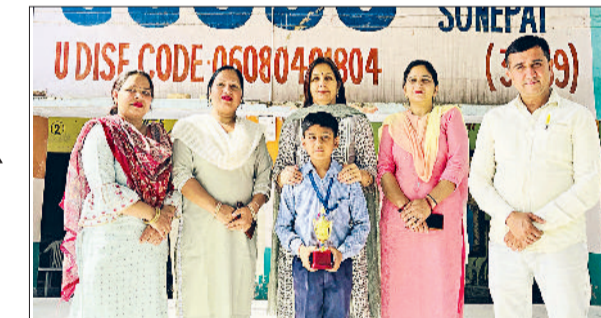
खरखौदा। छात्र को सम्मानित करते शिक्षक।

शौचालय बनवाए गए हैं। शौचालयों के निर्माण से शहरवासियों को स्वच्छ और सुविधाजनक शौचालय सुविधा प्रदान होगी जिससे स्वच्छता और स्वास्थ्य को बढ़ावा मिलेगा। नप चेयरपर्सन ने कहा कि इस मिशन का उद्देश्य स्वस्थ, स्वच्छ और विकसित भारत का निर्माण करना है। इसी सोच को आगे बढ़ाते हुए नगर परिषद निरंतर प्रयासरत है। उन्होंने कहा कि प्रधानमंत्री की इस पहल से स्वच्छता को एक जन आंदोलन का रूप मिला है।