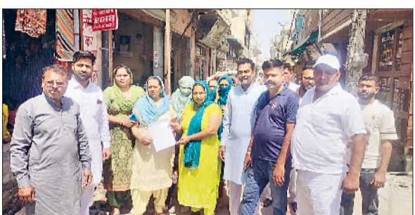
खरखौदा। रोष प्रदर्शन करते दुकानदार व पार्षद।

शहर के वार्ड 11 की गली का मुख्य बाजार से जुड़ाव होने के कारण महिलाओं के मतलब के सामान की बहुत सी दुकानें हैं। गली में नालियों को प्लास्टिक पाइप बिछाए जाने का काम शुरू किया था। एक मौखिक शिकायत पर चेयरमैन ने ठेकेदार को काम रोकने के निर्देश दिए थे, जिसके बाद से काम रुका है। अप्रत्याशित रूप से काम रुकने से गली में गंदगी फैल गई है। मलबे का उठान भी रुका हुआ है। स्कूल जाने वाली एक बच्ची गिरने से उसके पांव में फ्रैक्चर हो गया है। कई दुकानों के आगे गड्ढे होने के कारण दुकानदारी प्रभावित हो रही है। महिला दुकानदारों का कहना है कि चेयरमैन द्वारा काम रुकवाए जाने से दुकानदार व वार्ड वासी परेशान हैं। कॉलेज छात्राओं व दिल्ली चौक बाजार से आने जाने वालों को काफी दिक्कत पेश आ रही है। पाइप को लेकर उठ रहे सवाल: महिलाओं का कहना है कि आधे शहर में पाइप