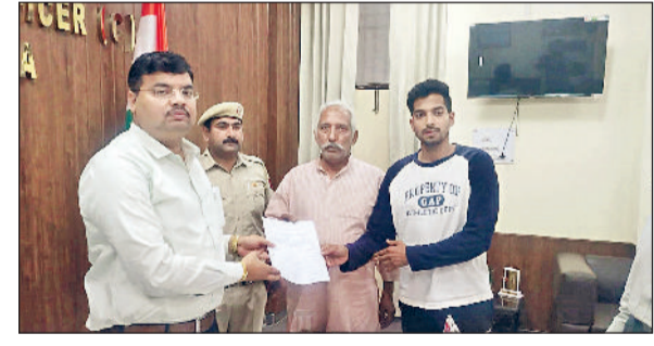
खरखौदा। गली निर्माण हेतु एसडीएस से मुलाकात करते भुक्तभोगी।

ब्राह्मण दरवाजे के पास स्थित माता वाली गली के वाईवासी गुरुवार को एसडीएस से मिले और बताया कि उक्त गली का तल मुख्य गली से काफी नीचा है। जिसके कारण पूरा साल निकासी की व्यवस्था चीपट रहती है। इसलिए इस गली को ऊंचा उठाया जाना जरूरी हो गया है। गली वासियों का कहना है कि गली को ऊंचा उठाए जाने पर सभी सहमत हैं। इसलिए इस गली को ऊंचा उठवाया जाए, ताकि समस्या का स्थाई समाधान हो सके। एसडीएस डॉ. निर्मल नागर ने संबंधित