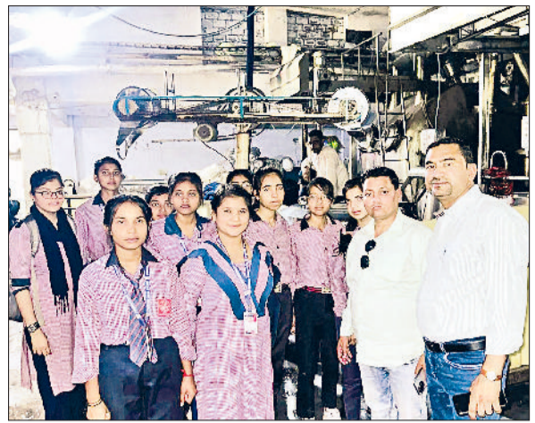
गन्ौर। राजकीय स्कूल की छात्राएं डाइग प्रोसेसिंग कंपनी में प्रोसेसिंग की जानकारी लेते हुए।

चार मंजिला फैक्टरी का ढांचा जर्जर हो चुका है। ऐसे में उसके गिरने का भय बना हुआ है। जिसके चलते अंदर तलाशी अभियान चलाने के दौरान सतर्कता बरती जा रही है। फैक्टरी का पूरा भवन आग की चपेट में आ गया था।