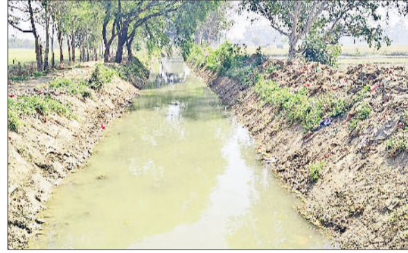
गन्नौर। सफाई के बाद राजपुरा माइनर में बहता हुआ पानी।