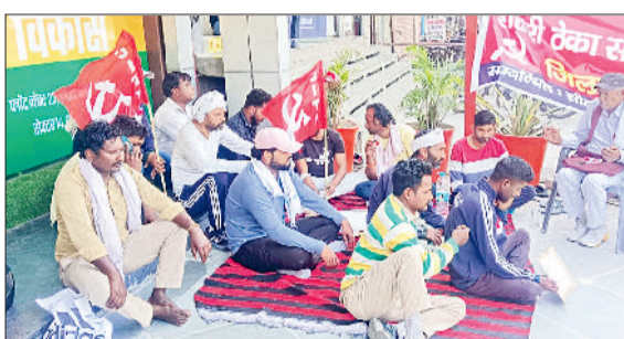
सोनीपत। विधायक कार्यालय के बाहर विरोध प्रदर्शन करते ठेका सफाई कर्मचारी।

लाइन दब चुके हैं, अब पाइप की क्वालिटी पर संदेह किया जा रहा है। बिना जांच के बाजार की मुख्य गली में काम रुकवाए जाने से परेशानी बढ़ रही है। मलबा भी उठाने से रोका गया है, इसका मतलब क्या है जानबूझकर परेशान करने की कोशिश की जा रही है। इस संदर्भ में दुकानदार सीएम नायब सैनी को शिकायत करेंगे। कमीशन को लेकर चर्चा: काम रुकवाने के पीछे कमीशन को लेकर